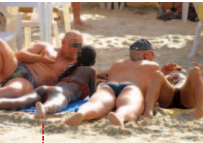
Na praia do Futuro, os programas começam cedo, a partir das 11h. Abaixo, uma menina dança em um bar da praia de Iracema